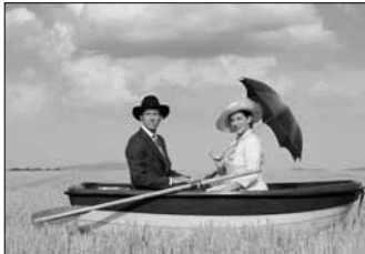
2004: "schön & gut"