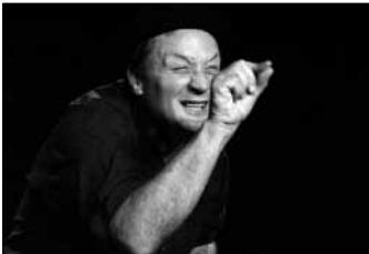
2003: "Ferruccio Cainero"