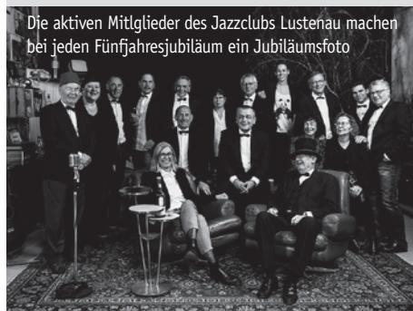
Die aktiven Mitglieder des Jazzclubs Lustenau machen bei jedem Fünfjahresjubiläum ein Jubiläumsfoto