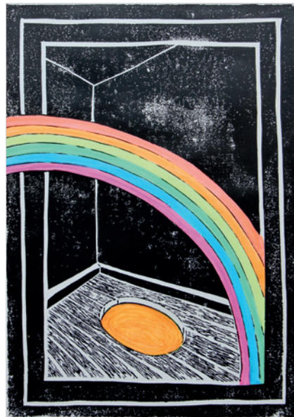
Linolschnitt, 297 x 420mm

Mit herzlichen Grüssen Vorstand Kulturverein Widnau