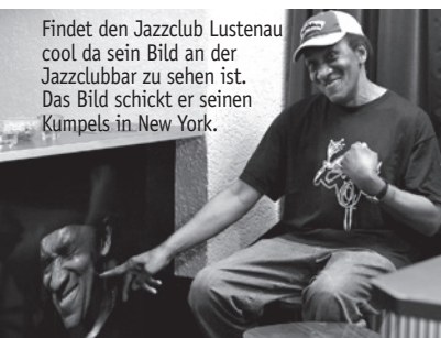
Findet den Jazzclub Lustenau cool da sein Bild an der Jazzclubbar zu sehen ist. Das Bild schickt er seinen Kumpels in New York.